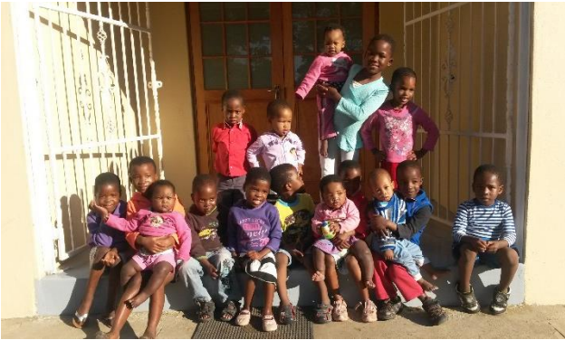
Kinderen van Destiny House voor hun nieuwe huis

FfA bestaat 10 jaar als stichting! Wat een mijlpaal. Gezamenlijk haalden we reeds ruim € 140.000 op, en daar mogen we met recht trots op zijn.