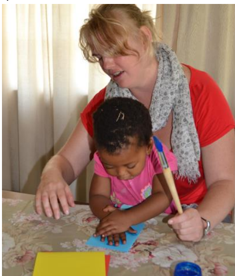
Knutselen bij iKhaya