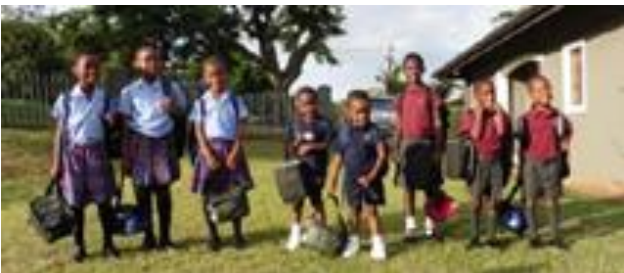
Klaar voor de schooldag!

Van de inmiddels 20 kinderen bij iKhaya Likababa zijn er in 2016 9 schoolgaande kinderen (allen basisschool leeftijd). Hiervan volgen 3 kinderen speciaal onderwijs, en 6 gaan naar de reguliere lokale school. Friends for Africa betaalt voor deze kinderen het schoolgeld.