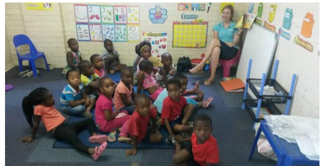
Verhaaltjes-tijd bij de preschool van Destiny House

Destiny House opent een 'preschool', vergelijkbaar met de crèche in Nederland. "De preschool is zowel toegankelijk voor de eigen kinderen van Destiny House als voor de gemeenschap eromheen. Zo krijgen de kinderen al op een jonge belangrijke leeftijd toegang tot het eerste onderwijs. De huidige preschool is tijdelijk gevestigd in de naastgelegen basisschool, maar de bedoeling is dat er een (eenvoudig) eigen gebouwtje gerealiseerd wordt voor de preschool. Hier zullen dan twee klaslokalen komen voor de leeftijd 3-4 en 4-5 jaar. Er moet ruimte zijn voor 40 kinderen." FfA draagt bij aan de kosten van de bouw van de preschool.