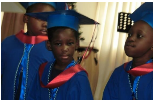
iKhaya kindje Lulu bij een schooluitreiking

Ook dit jaar ondersteunt FfA (voor het vijfde jaar op rij) bij de schoolkosten van de kinderen van iKhaya en bij de salarissen van de huismoeders.