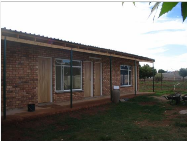
De gerealiseerde speel- en opslagruimte