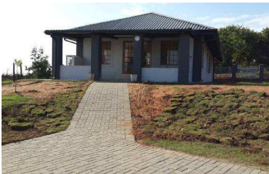
Het nieuwe huis voor de oudere kinderen en hun pleegouders

moeder is in dienst van iKhaya Likababa als huismoeder. Doordat dit stel ook echt in het huis woont, met de kinderen, worden de kinderen toch onderdeel van een heus gezin. Het huisje staat vlak naast het hoofgebouw, en dus kunnen de kinderen overdag gewoon met hun 'jongere broertjes en zusjes' spelen, en ook de huismoeders zien. Er zijn inmiddels 3 oudere kinderen naar het doorgroei-huis overgegaan en ze genieten er enorm van dat ze nu een papa en mama hebben waar ze 's avonds mee kunnen eten, en die hun helpen met hun huiswerk.