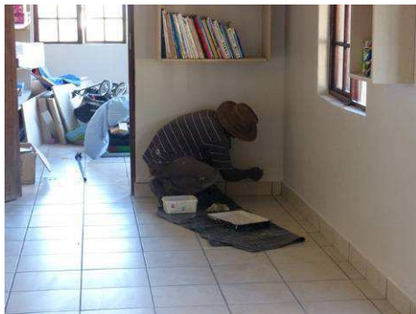
De tegelzetter aan het werk

Daarnaast hebben we er in de afgelopen maanden voor gezorgd dat in het hoofdgebouw van iKhaya een tegelvloer aangelegd kon worden en dat het gebouw van binnen een nodige verfbeurt heeft gekregen.