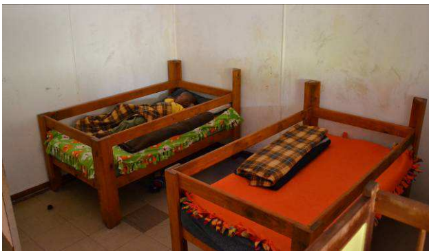
Slaapkamertje in de tijdelijke accommodatie