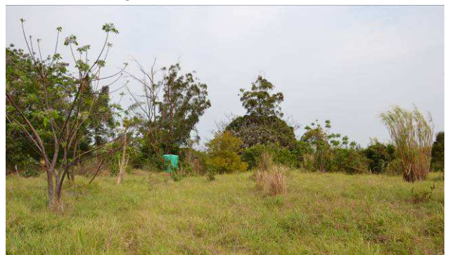
Hier moet de nieuwbouw gaan komen. Deze locatie is naast de school waar de kinderen naar toe gaan.

Destiny House biedt momenteel onderdak aan 17 kinderen in een tijdelijke accommodatie. Er is behoefte aan een ruimer eigen onderkomen. In de vorige nieuwsbrief vermelden we al dat er gepland was eind 2013 met de bouw van start te gaan. Helaas is er vertraging opgelopen bij de vergunning aanvraag en daarom zal dit doorgeschoven worden naar 2014.