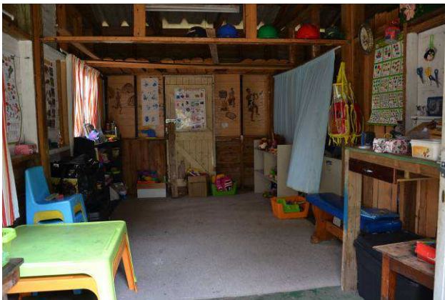
Het huidige 'klasje' waar de kleinste die nog niet naar school gaan les krijgen